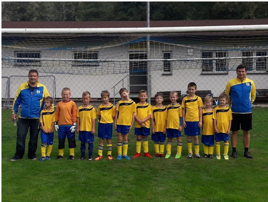
V září 2018 nejmenší Chrusteňáci před domácím turnajem.